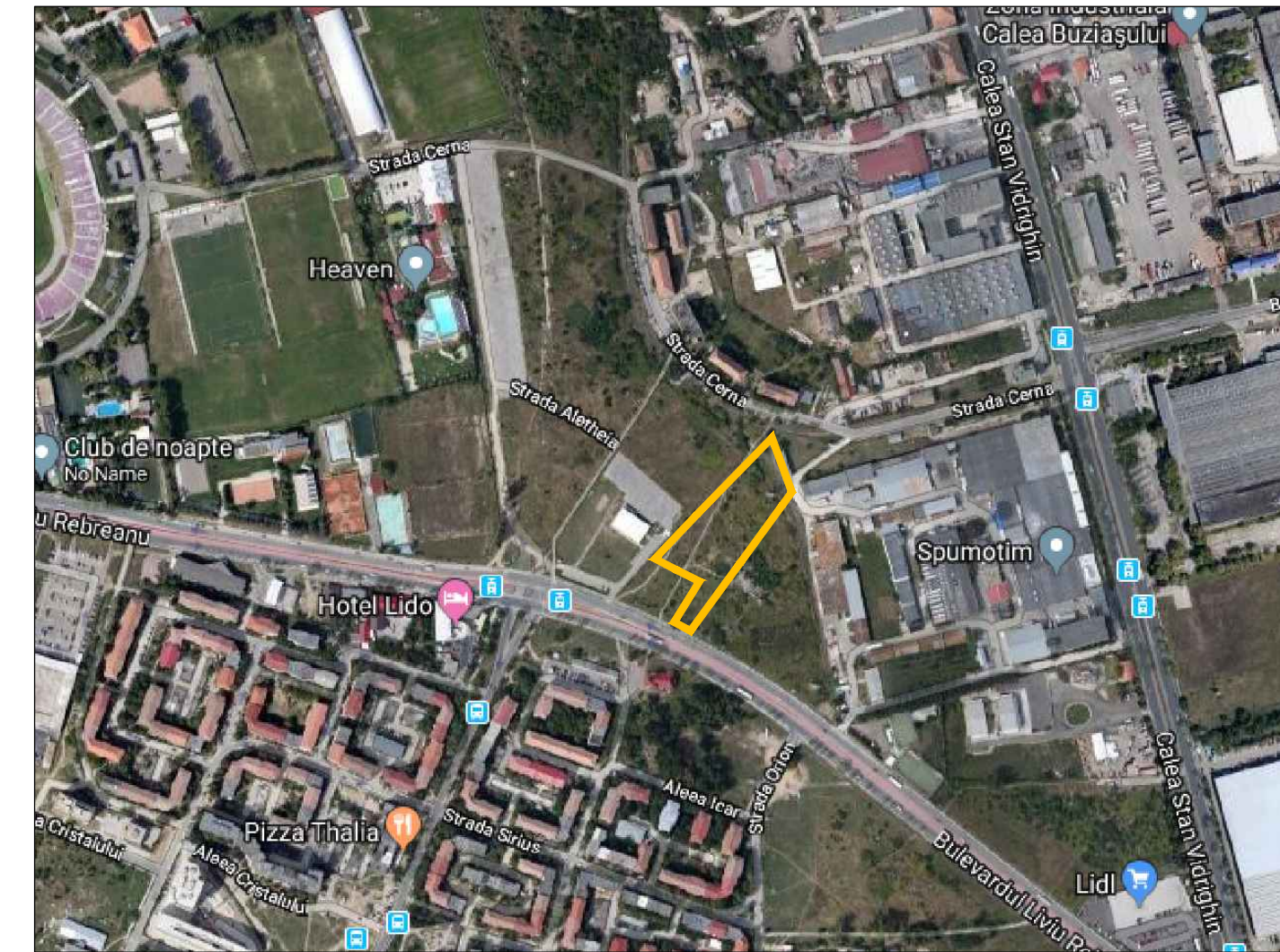
Limita teren P.U.Z./ Limita proprietate