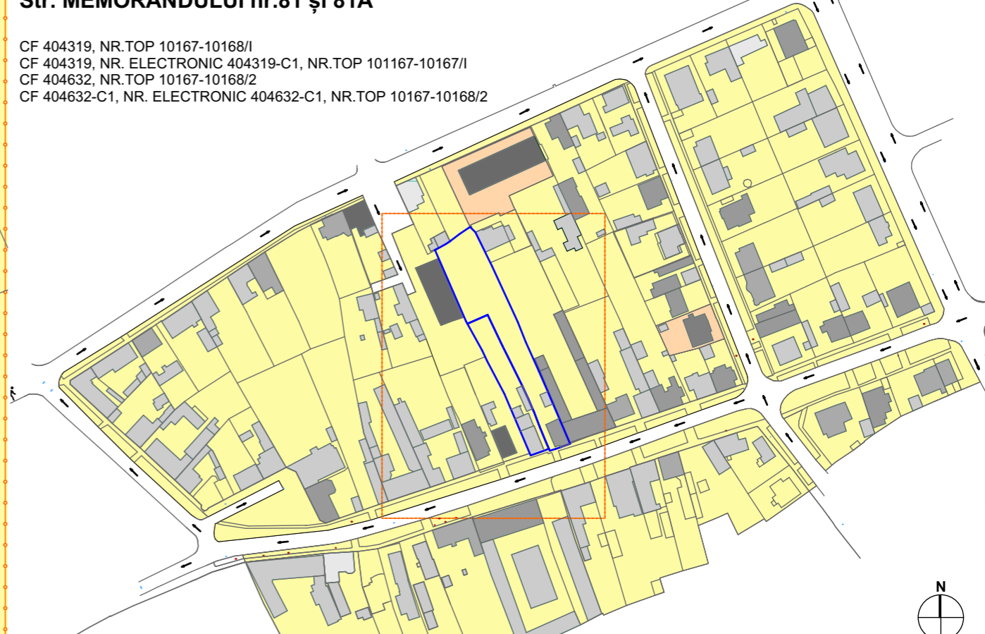
PLAN DE ÎNCADRARE SC 1:2500