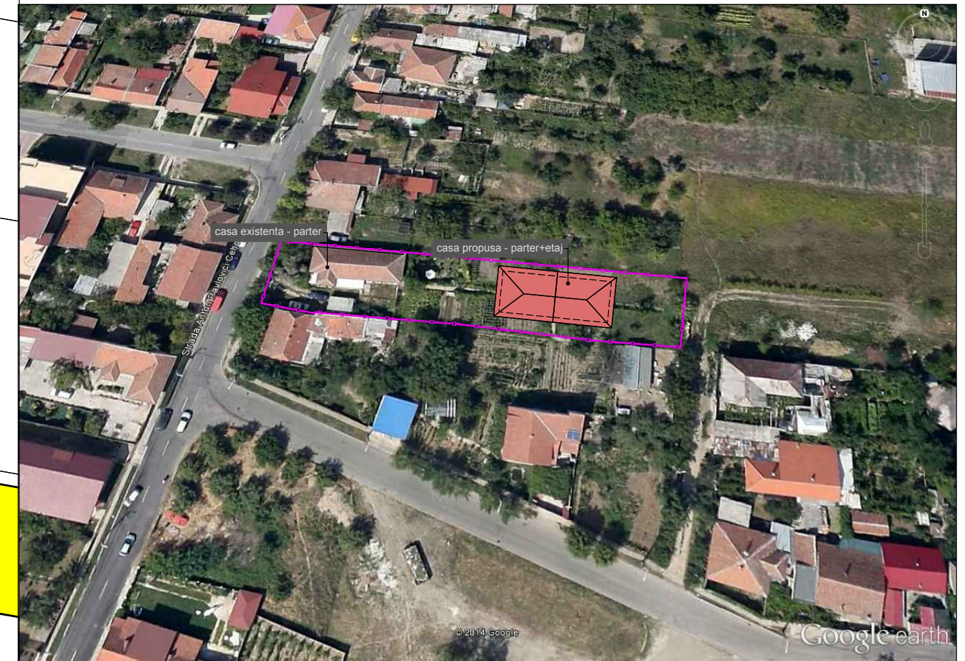
Propunere de amplasare a noii case P+1E