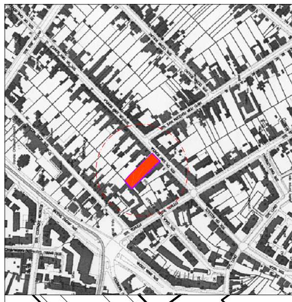
PLAN DE INCADRARE IN LOCALITATE 1:5000