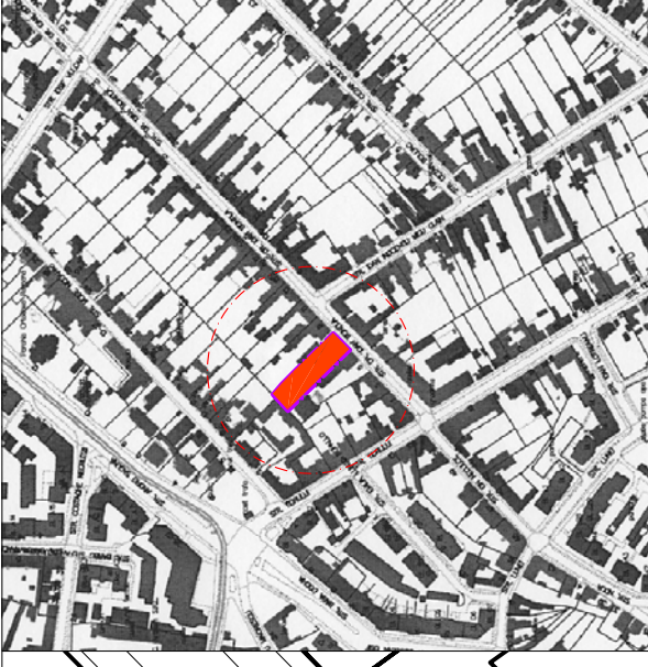
PLAN DE INCADRARE IN LOCALITATE 1:5000